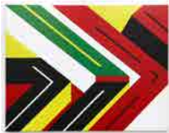
Olsen, 1991.

Peter Stämpfli s'est attaché dans les années soixante, au sein du mouvement de la Figuration narrative, à puiser ses sujets dans l'environnement quotidien (téléphone, machine à laver, automobile) et les gestes ordinaires (tenir une cigarette), qu'il monumentalise et transfigure, dans un contexte où l'image publicitaire a besoin de se multiplier. Depuis 1966, sa peinture s'articule autour d'un objet emblématique de la société industrielle et urbaine : le pneu. Depuis plus de cinquante ans, l'artiste a exploré, analysé, décortiqué ce motif, y compris à travers la sculpture, avec un tel approfondissement du détail, des contrastes et des couleurs, que son œuvre se rapproche de l'abstraction géométrique.