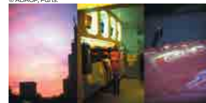
Ombre, FNAC 01-762. Crédit photo. : Bernard Joisten. © ADAGP, Paris.