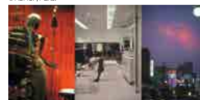
Ombre, FNAC 01-764. Crédit photo. : Bernard Joisten. © ADAGP, Paris.