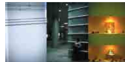
Ombre, FNAC 01-759. Crédit photo. : Bernard Joisten. © ADAGP, Paris.

Bernard Joisten a développé des créations mêlant une nostalgie et une admiration pour le style de vie dans les pays industrialisés des années 1980 et 1990 avec une pratique teintée d'onirique. Ses œuvres imprégnées de références cinématographiques et plus particulièrement de l'univers SF, sont conçues comme des indices narratifs qui invitent au parcours mental et à la reconstitution d'un scénario. Ces photographies ont été réalisées dans le cadre de sa résidence à la Villa Kujoyama à Kyoto au Japon. Avec ces images, fonctionnant un peu à la manière d'un story-board, l'artiste joue avec les représentations d'objets et les décors, dans des mises en scène facilitant l'immersion dans un univers urbain fictionné.