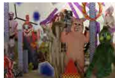
Double conscience, 2010. Détail de l'installation, dimensions variables, cartons et vitryles imprimés. Vue Fondation d'entreprise Ricard, Paris.

Le travail de Soraya Rhofir se nourrit d'une consommation quotidienne du spectacle télévisuel, d'icônes tombées en désuétude, de stratégies illusionnistes et d'artifices décoratifs. L'artiste compose ses images en glanant et en sélectionnant au préalable, sur internet, une banque d'images « en libre service » et qui va lui servir par la suite d'outil, de matériau. L'installation « Double conscience » réunit des sculptures plates représentant des personnages et objets, issus de cette culture visuelle occidentale qu'elle se réapproprie. À travers des références à des mythes antiques et contemporains, se dessine dans cette mise en scène la trame d'un récit d'anticipation ou sa reconstitution.