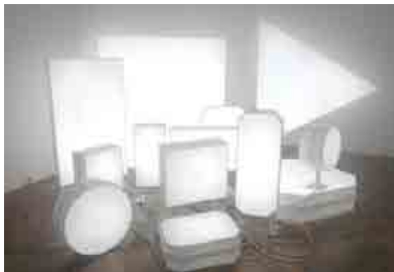
Sans titre (Close Encounter), 2006. Photographe : Sébastien Agnetti. © ADAGP, Paris.